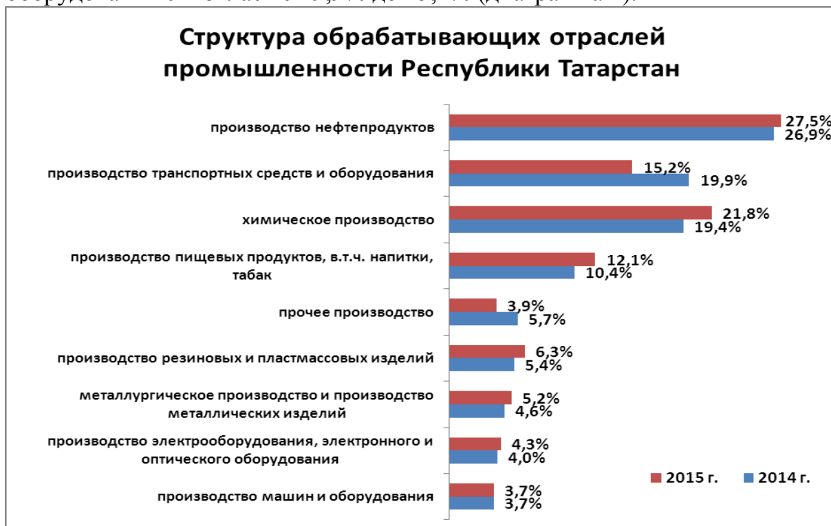
Диаграмма 2. Структура обрабатывающих отраслей промышленности Республики Татарстан.

В структуре обрабатывающих производств увеличилась доля производства нефтепродуктов с 26,9% в 2014г. до 27,5% в 2015г., соответственно, химического производства - с 19,4% до 21,8%, производства резиновых и пластмассовых изделий - с 5,4% до 6,3%, металлургического производства и производства готовых металлических изделий - с 4,6% до 5,2%, электрооборудования, электронного и оптического оборудования – с 4% до 4,3%. Вместе с тем, доля производства транспортных средств и оборудования снизилась с 19,9% до 15,2% (диаграмма 2).